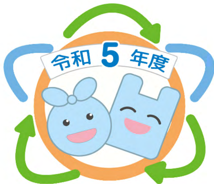
横浜市一般廃棄物収集運搬業優良事業者